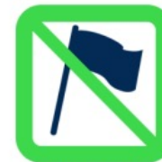
Hampes rigides, fagots de drapeaux Flagpoles