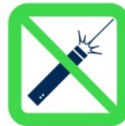
Pointeurs laser Laser Pointers