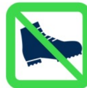
Chaussures de sécurité Safety Footwears