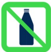
Bouteilles - Contenants à bouchon - Verres - Canettes Bottles - Cork containers - Glasses - Cans