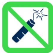
Articles pyrotechniques et matériels explosifs Pyrotechnics and explosive materials